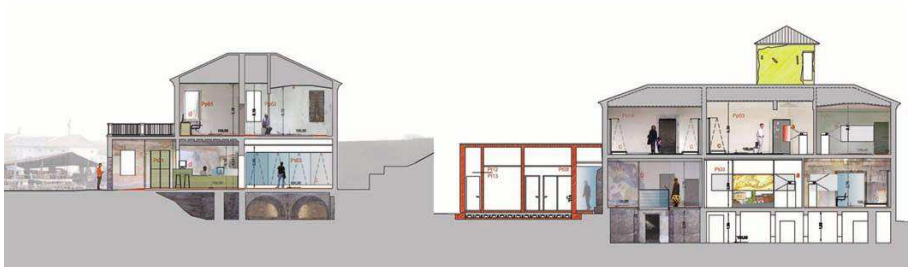
Museo del fiume

2008-09 Importo lavori 400.000,00 € I° Lotto 275.000 € II° Lotto Committente Comune di Rodigo bc Bizzo-Cornacchini Progettazione completa e DL, Realizzato 2009-11