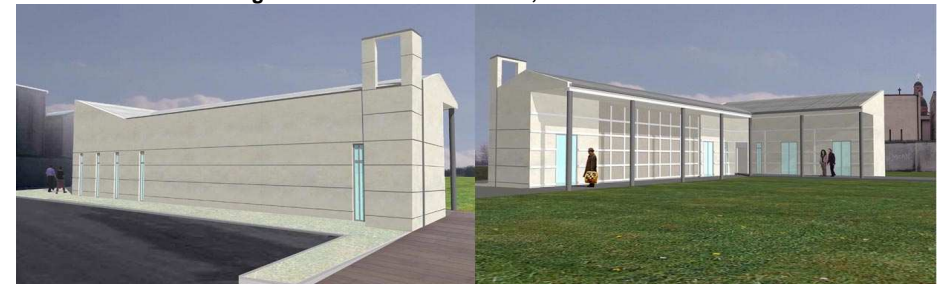
Cimitero di Ospitaletto

2005 Importo stimato 100.000 € Committente Comune di Castellucchio (MN) bc Bizzo-Cornacchini Progetto definitivo ed esecutivo, Realizzazione 2005-6