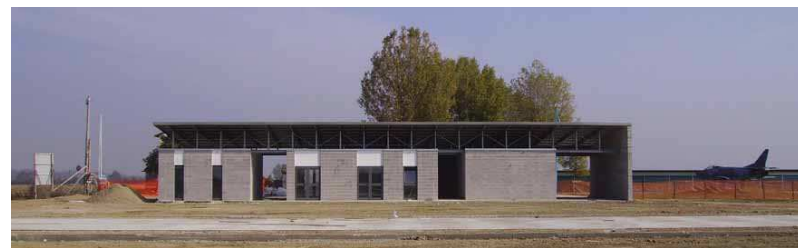
Canile di Faenza

2005-06 Importo stimato 1.200.000 € I° Lotto 600.000 € Committente Comune di Faenza (RA) Arch Coveri Comune di Faenza, bc Bizzo-Cornacchini Progetto preliminare, definitivo ed esecutivo