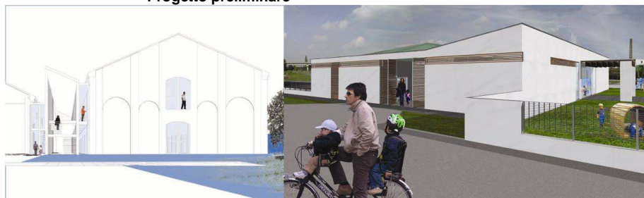
Aule, asilo aziendale

2003 Importo stimato 550.000 € Committente Università degli Studi di Ferrara Stefano Cornacchini, Servizio Tecnico UNIFE Progetto preliminare