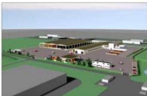
Impianto di produzione compost

La realizzazione delle discariche controllate per rifiuti non pericolosi viene in genere completata con il recupero del biogas attraverso la cogenerazione e il trattamento in loco del percolato mediante la tecnologia dell' addensamento o mediante l'uso di processi chimico-fisici.