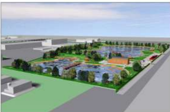
Area bacini di depurazione